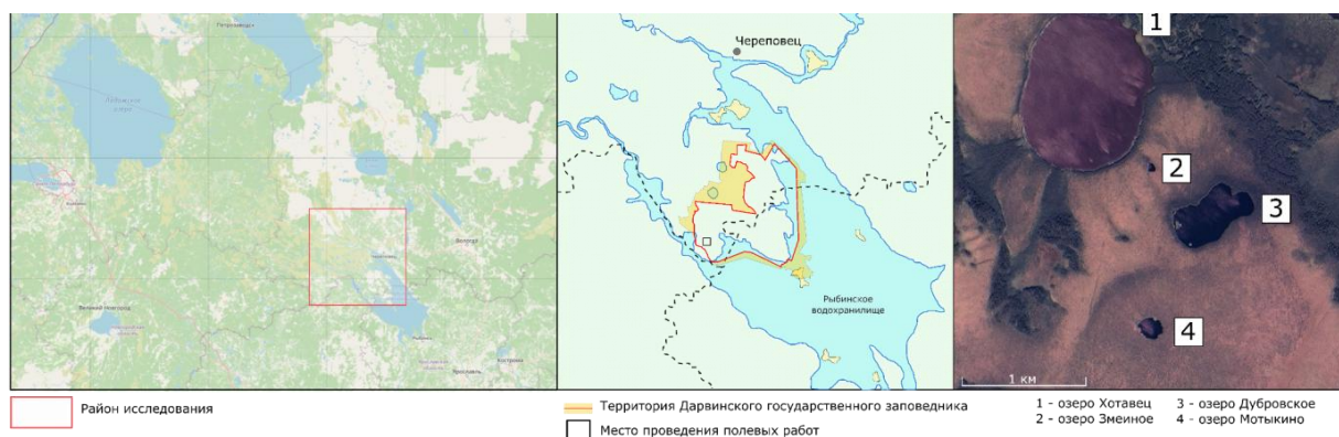
Рис. 1. Район исследования.

Озеро Змеиное (Рис. 1) - внутриболотный водоем, с площадью водного зеркала 3000 м 2 и глубиной 2,7 м, расположенный в 190 м к юго-востоку от оз. Хотавец и в 400 м к северо-западу от оз. Дубровского в пределах болотного массива «Большой Мох».