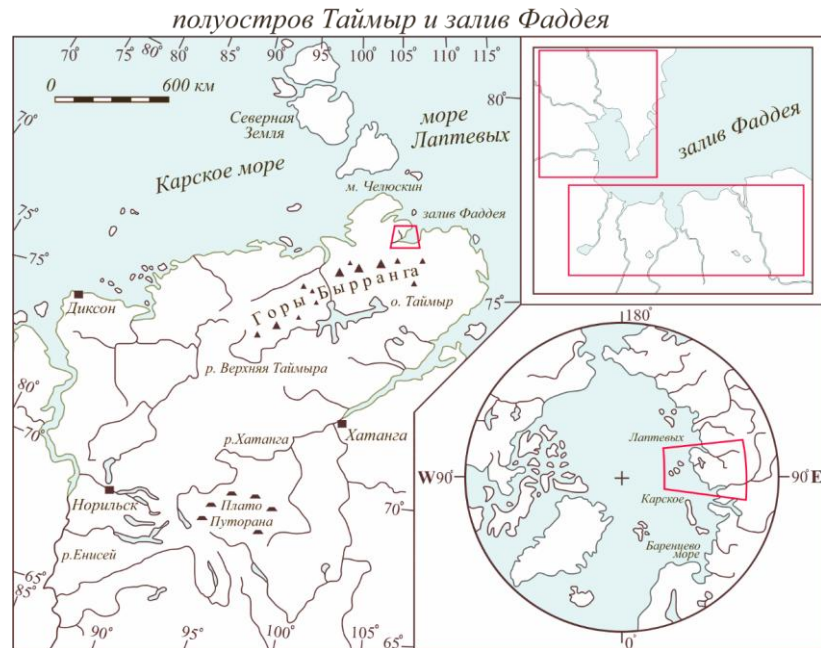
Рис. 1. Схема расположения участка геолого-съемочных работ масштаба 1:200 000 Северо-Восточного Таймыра

[Костин, Шнейдер, Триколиди, Куприянова, 2018]. К сказанному в упомянутой работе за прошедший год прибавились данные определений абсолютного возраста, позволившие еще более обоснованно представить схему расчленения четвертичных образований, причем для данного района это сделано впервые (Рис. 3).