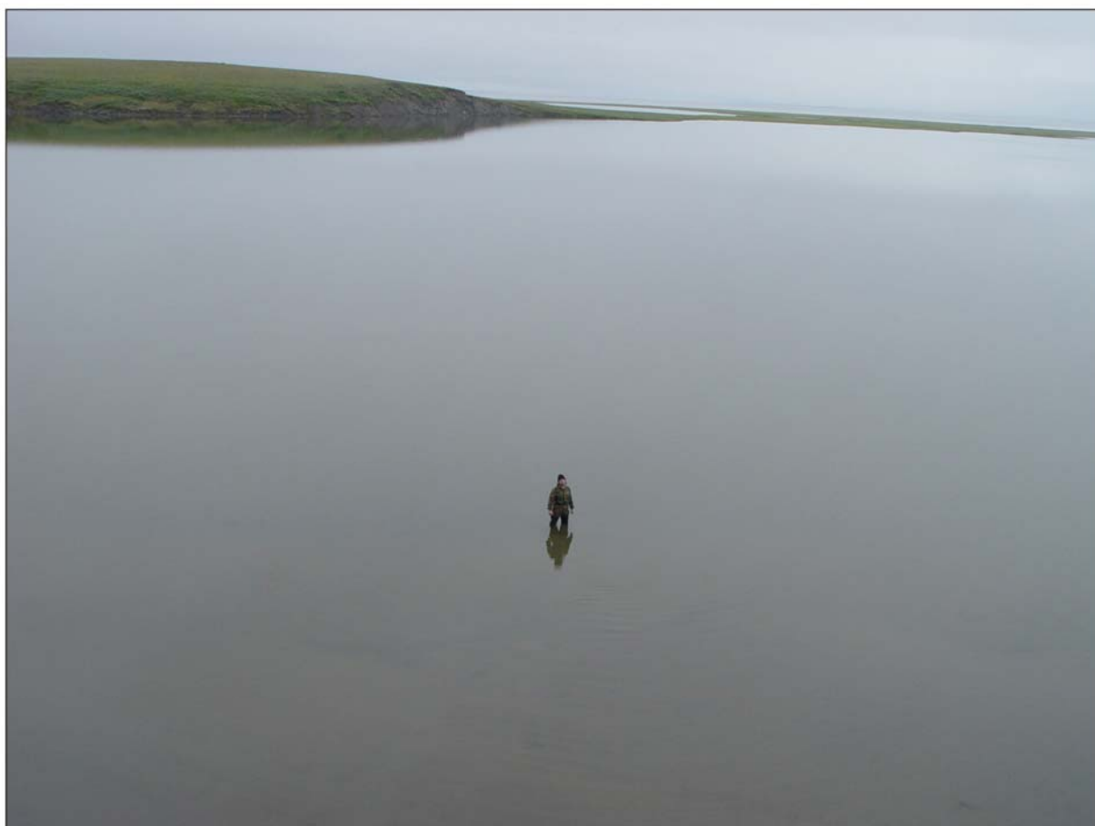
Рис. 4. Мелководное озеро Долган вблизи Сопочной Карги. Вдали видна коса, отделяющая озеро от Енисея.

свидетельствует о значительной неотектонической мобильности северной части Западно-Сибирской плиты и прилегающей складчатой области Таймыра.