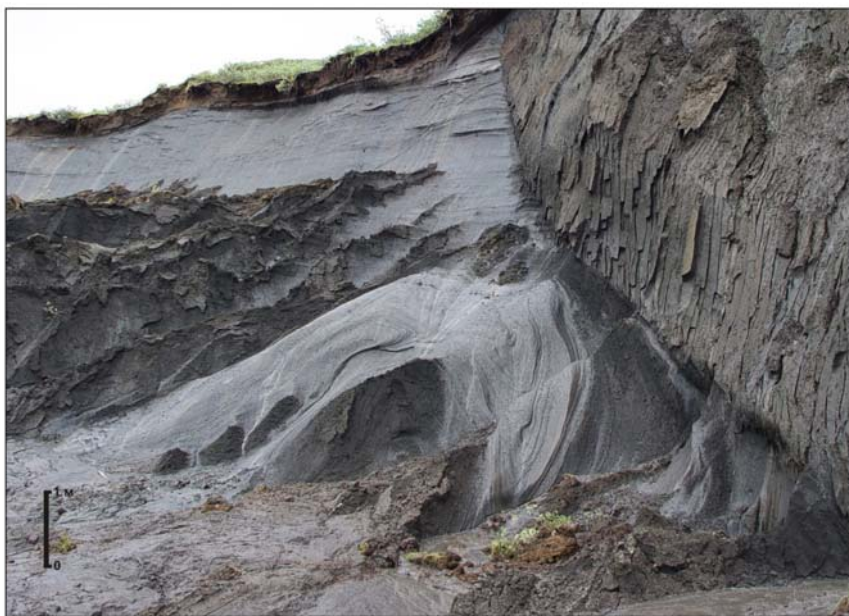
Рис. 3. «Ныряющая» ледяная складка в термоцирке вблизи Сопочной Карги.

Крупные складки с наклонными к горизонту осями, вплоть до лежачих, нарушающие четвертичные толщи, зафиксированы на западном берегу Енисейского залива к югу от мыса Зверевского (№ 3 на рис. 1, б на рис. 2), на восточном берегу к северу от Сопочной Карги (№ 7 на рис. 1, д на рис. 2), и у мыса Макаревича (№ 10 на рис. 1, е на рис. 2). Эти нарушения вызваны оползанием и смятием водонасыщенных вязкопластичных четвертичных толщ со склонов локальных зон неотектонического воздымания. Подчас трудно определить висячее и лежащее крылья складок, например, у мыса Зверевского. Однако в некоторых случаях это удастся сделать, например, для складок на восточном берегу залива у мысов Макаревича и Сопочная Карга. При этом оси складок наклонены в северном направлении (см. рис. 2 д и е), что не позволяет считать их гляциодислокациями предполагаемого Карского ледникового щита, якобы надвигавшегося с севера.