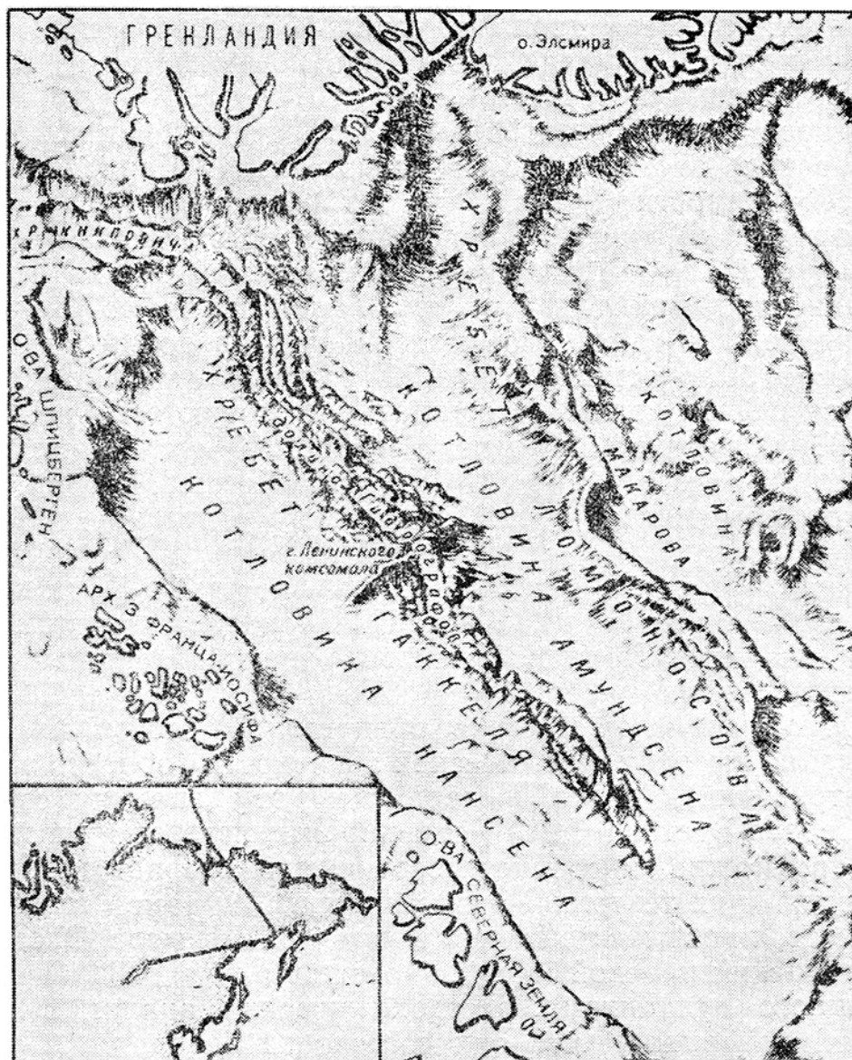
Фрагмент физиографической схемы дна Северного Ледовитого океана

В пределах хр. Гаккеля широко развиты поперечные разрывные нарушения, выраженные в рельефе хребтами или цепочками отдельных подводных гор, ориентированными приблизительно перпендикулярно простиранию срединного хребта. В качестве примера можно привести субмеридиональный хребет, приуроченный к наиболее резкому изменению простирания хр. Гаккеля на 87° с.ш. и 60° в.д. В ближайшей к рифту значительно более высокой части поперечного хребта находится гора Ленинского Комсомола. Весьма вероятно, что подводные горы, по аналогии с другими срединными хребтами, являются вулканами, но прямых указаний на это нет.